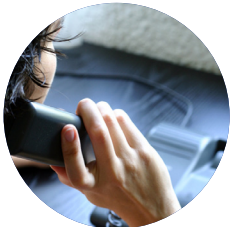
Các dịch vụ và các trang mạng của NSW

Nếu bạn có quan hệ với một người tình thường xuyên, nên bàn với nhau về những lựa chọn chung để bạn có thể có những quyết định mà cả hai cùng cảm thấy thoải mái.