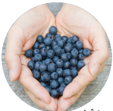
Chăm sóc bản thân

Nếu bạn có quan hệ với một người tình thường xuyên, nên bàn với nhau về những lựa chọn chung để bạn có thể có những quyết định mà cả hai cùng cảm thấy thoải mái.