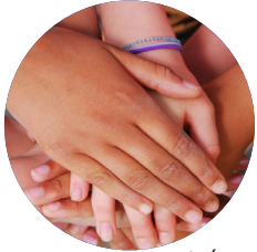
Vừa được chẩn đoán

HIV không tước mất ý muốn hoặc quyền có con của bạn. Những tiến triển trong việc điều trị HIV cho phép thực hiện điều này. Nguy cơ có một đứa con nhiễm HIV rất thấp.